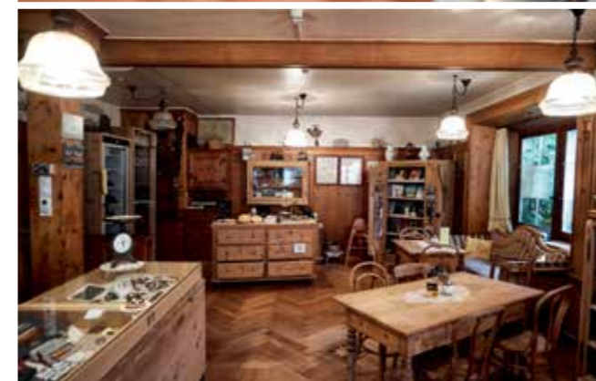
Die hausgemachten Capuns und weitere regionale Köstlichkeiten können im hauseigenen Laden gekauft werden.

50 Kilo Capuns-Teig setzt Andretta Schwarz jeweils am Sonntagabend an. Genug, um in der Woche darauf 1000 Portionen davon in Mangoldblätter zu wickeln, exakt nach dem Capuns-Rezept, das sie von ihrer Grossmutter übernommen hat. Produziert wird in der Küche der Alten Post in Zillis weit mehr, als die Gäste verzehren. Voll wird das Haus vor allem im Sommer, wenn die Wanderer und Touristen die für ihre einzigartige Bilderdecke bekannte romanische Kirche von Zillis besuchen. Im Winter finden nur einzelne Stammgäste und Dorfbewohner den Weg in die Alte Post. Die meisten Wintertouristen buchen ihre Zimmer im Skort Splügen oder im benachbarten Andeer mit seinem Mineralbad. Um die ruhige Zeit zu überbrücken, hat die Wirtin sich und ihren Betrieb neu erfinden müssen. Ihre Gaststube hat sie zur Hälfte in einen Laden mit regionalen Spezialitäten umgewandelt, in der Küche die Produktion von Capuns und Nusstorte ausgebaut. Die Nusstorten und die traditionellen Bündner Mangoldwickel verschickt sie in die ganze Schweiz, die Capuns auch in einer vegetarischen Variante. «Allein vom Gasthaus könnte man hier nicht mehr leben, die Produktion und der Versand von eigen-