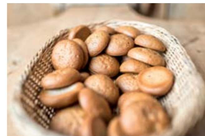
16 Gewürze sind für den Geschmack der Tamburins verantwortlich.