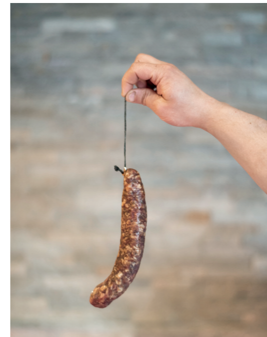
Der Geschmack der Landschaft in der Gourmettheke: edle Roh- und Trockenwürste aus der Boucherie Junod.